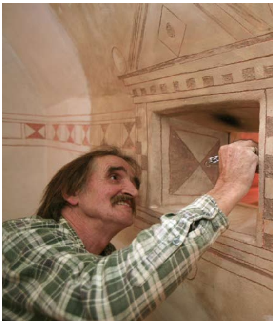
Alles feinste Handarbeit: Im San Gabriele stimmt jedes Detail.