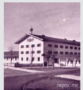
Viele fragten, aber niemand zog so recht. Jetzt scheint definitiv eine Investorengruppe fürs Rasthaus in Felden gefunden.

Bildende Kunst / Bernhard Springer in Aschau, Pippi & Co in Rosenheim: Seiten X und XI Schauspiel / Sugar Dollies in Wasserburg: S. IX; Nations / Intelligent Design vs. Darwin: Seite XV