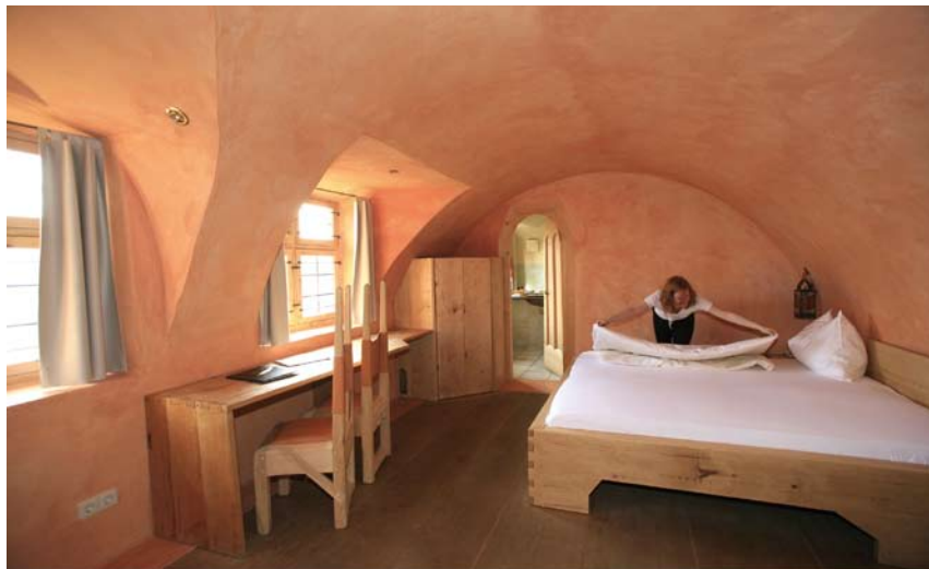
Ein Hotel, das niemals veraltet - weil es schon sehr alt ist.

Schon beim Betreten des im italienischen Landhausstil gehaltenen Hotels fühlt man sich wohl. Warum genau, kann man gar nicht so einfach sagen. Ist es das viele Holz, die Steinfußböden mit dicken Findlingen oder die Behaglichkeit durch die vielen Nischen? Die 38 Zimmer befinden sich auf drei Ebenen. Hier wurde nichts dem Zufall überlassen, alles, selbst das kleinste Detail, trägt die Handschrift des Eigentümers. Hohe Giebel, luftig-lichtdurchflutete Zimmer mit viel Holz, italienischen Stoffen und breiten Himmelbetten entsprechen modernem Hoteldesign. Das Bad hebt sich durch die ungewöhnlichen granatapfelroten Glaswaschtische nach Murano-Mannier von den üblichen Monoblock-Hotelbädern ab. Auch die Sinne bedient das San Gabriele. Ähnlich wie das berühmte Künstlerhotel Luise in Berlin, lässt auch Mattera Künstler