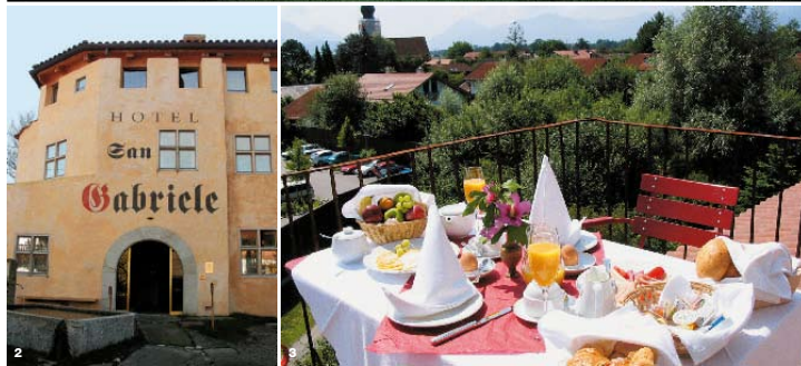
1. und 2. Hotel San Gabriele und Restaurant Il Convento: Die ansprechende Fassade des Hotels wurde auf alt getrimmt, um das Flair eines Klosters aufleben zu lassen. 3. Genuss pur: Frühstück unter freiem Himmel. 4. und 5. Die mittelalterlichen Gewölbe und aufwendigen Details bieten den perfekten Rahmen für gesellige Stunden.

Un restaurant renommé en plein coeur de Rosenheim appelé Il Monastero fait parlé de lui grâce à son ambiance médiévale. Pas étonnant qu'on ait eu l'idée de transformé l'hôtel conformément à l'image d'un couvent.