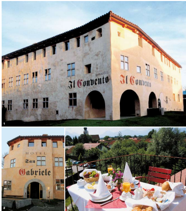
1. und 2. Hotel San Gabriele und Restaurant // Convento: Die ansprechende Fassade des Hotels wurde auf alt getrimmt, um das Flair eines Klosters aufleben zu lassen. 3. Genuss pur: Frühstück unter freiem Himmel. 4. und 5. Die mittelalterlichen Gewölbe und aufwendigen Details bieten den perfekten Rahmen für gesellige Stunden.

Im „Klosterhotel“ San Gabriele in Rosenheim können Sie eine romantische Zeit verbringen, ohne ein Gelübde ablegen zu müssen. Gott sei Dank, denn vor allem die exquisite Küche ist eine echte Sünde wert!