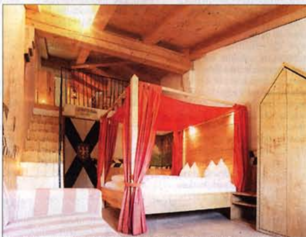
Ein richtiges Himmelbett darf im Klosterhotel San Gabriele natürlich auch nicht fehlen.