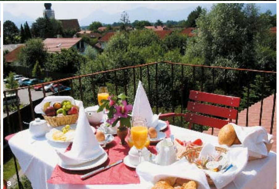
1. und 2. Hotel San Gabriele und Restaurant Il Convento : Die ansprechende Fassade des Hotels wurde auf alt getrimmt, um das Flair eines Klosters aufleben zu lassen. 3. Genuss pur: Frühstück unter freiem Himmel. 4. und 5. Die mittelalterlichen Gewölbe und aufwendigen Details bieten den perfekten Rahmen für gesellige Stunden.